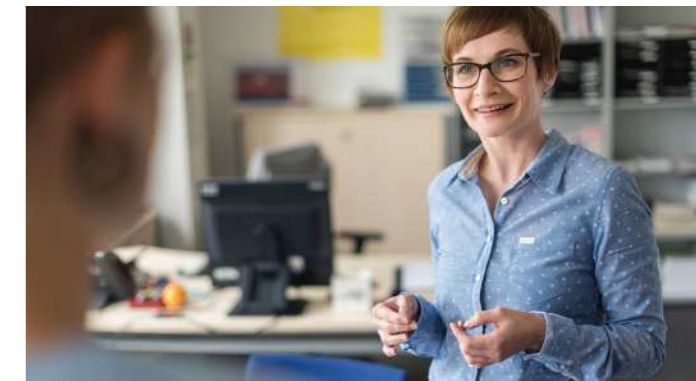
Übungen schon vor der Prüfungssituation helfen ungemein dabei, Prüfungsangst zu meistern!

Anmeldung und Infos: werkswelt.de/kursangebot